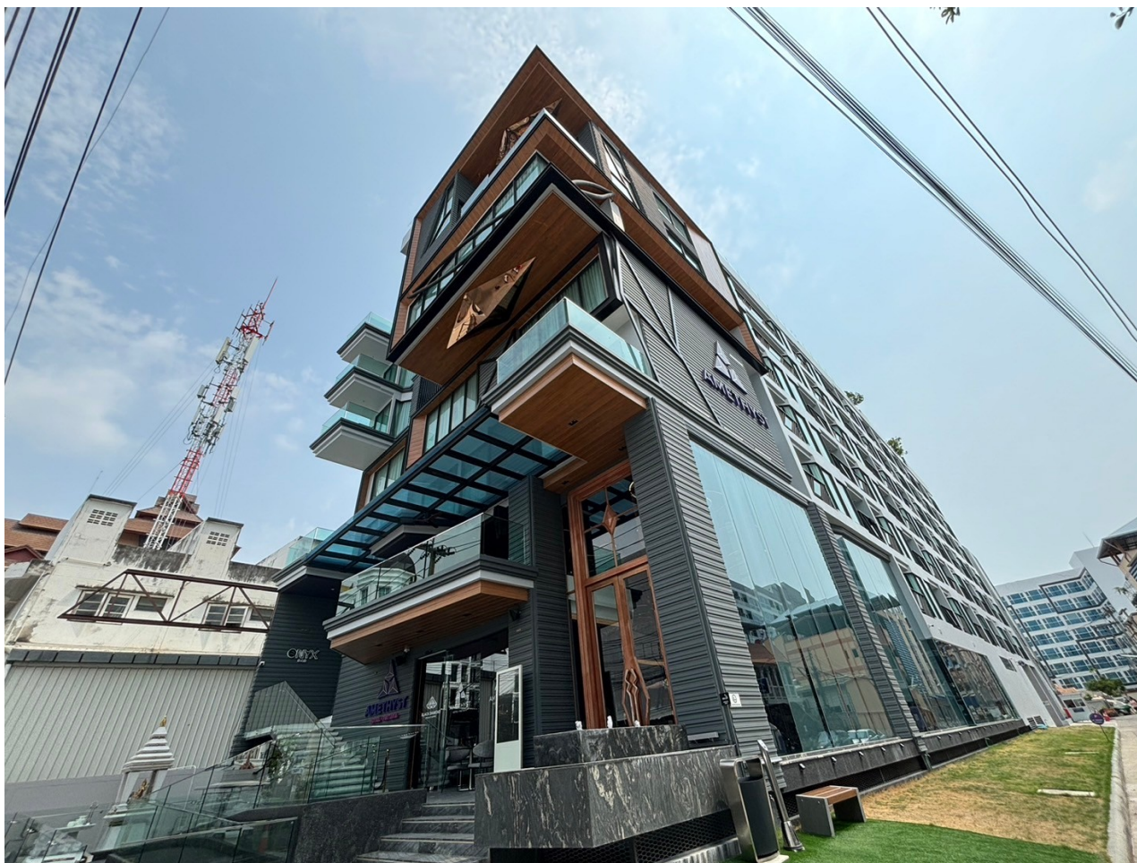
รูปที่ 1.3 สภาพโครงการในปัจจุบัน