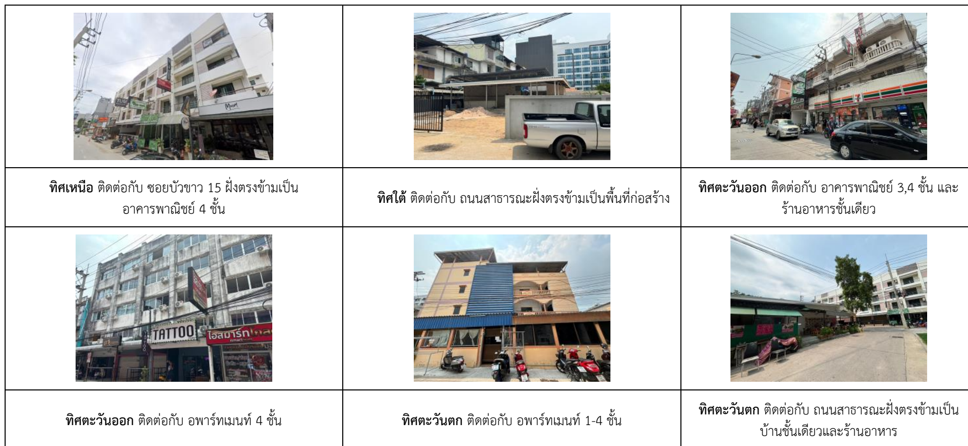
รูปที่ 1.2 ฝั่งแสดงการใช้ประโยชน์บริเวณพื้นที่โครงการและพื้นที่ใกล้เคียง